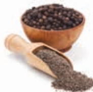
Fekete bors őrölt, 250 g

250 g/cs 849,- Ft/cs + áfa Bruttó ár: 1078,23