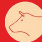
FRISS sertéskaraj csont nélkül