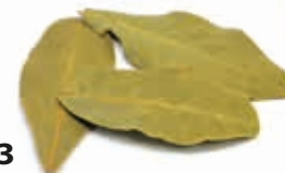
Babérlevél egész 250 g

250 g/cs 549,- Ft/cs + áfa Bruttó ár: 697,23