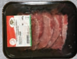
Szeletelt sertés karaj