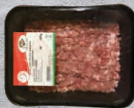
Sertés darálthús 70%