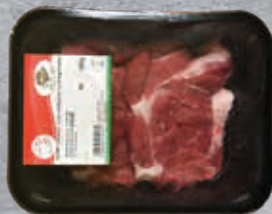
Szeletelt sertés tarja