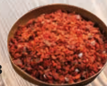
Magyaros fűszerkeverék 250 g

250 g/cs 499,- Ft/cs + áfa Bruttó ár: 633,73