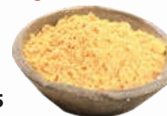
Gyömbér őrölt, 250 g

250 g/cs 575,- Ft/cs + áfa Bruttó ár: 730,25