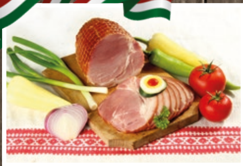
FÜSTÖLT KÖTÖZÖTT LAPOCKA 1399 Ft/kg+áfa