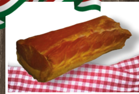
FÜSTÖLT ANGOL SZALONNA 1159 Ft/kg+áfa