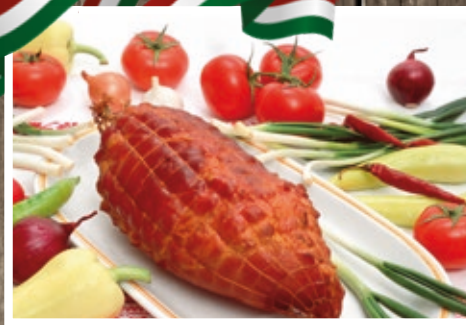
FÜSTÖLT KÖTÖZÖTT COMB 1499 Ft/kg+áfa