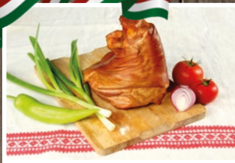
FÜSTÖLT HÁTSÓ CSÜLÖK 1159 Ft/kg+áfa