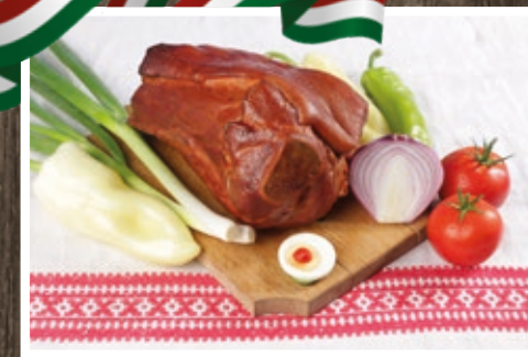
FÜSTÖLT HEGYESI HÚSVÉTI LAPOCKA 1269 Ft/kg+áfa

TOVÁBBI INFORMÁCIÓKÉRT ÉRDEKLŐDJÖN ÉRTÉKESÍTŐINKNÉL: ☎ 06 80/201-101