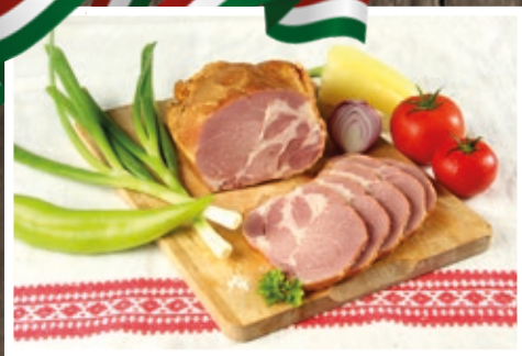
FÜSTÖLT TARJA 1759 Ft/kg+áfa