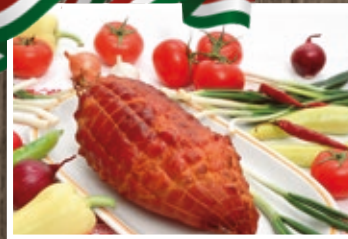
FÜSTÖLT KÖTÖZÖTT LAPOCKA