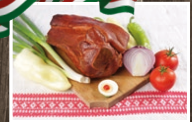
FÜSTÖLT HÉGYESI HÚSVÉTI LAPOCKA