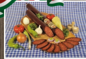
MÉTERES PAPRIKÁS KOLBÁSZ