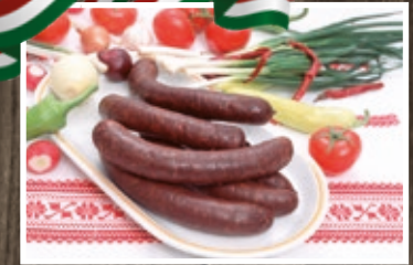
MÁJAS, VÉRES HURKA