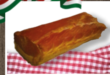
FÜSTÖLT ANGOL SZALONNA