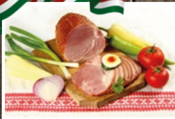
FÜSTÖLT KÖTÖZÖTT LAPOCKA