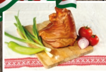
FÜSTÖLT HÁTSÓ CSÜLÖK