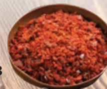
Magyaros fűszerkeverék 250 g

250 g/cs 449,- Ft/cs + áfa Bruttó ár: 570,23