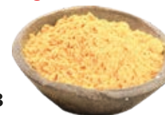
Gyömbér őrölt, 250 g

250 g/cs 499,- Ft/cs + áfa Bruttó ár: 633,73