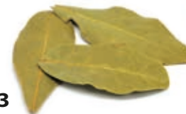
Babérlevél egész 250 g

250 g/cs 549,- Ft/cs + áfa Bruttó ár: 697,23