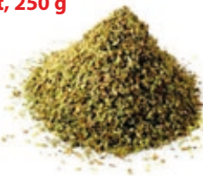
Majoranna morzsolt, 250 g

250 g/cs 439,- Ft/cs + áfa Bruttó ár: 557,23