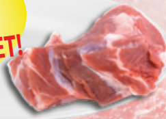
FRISS marhalábszár csont nélkül