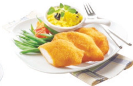
Pan. pác. Csirkemellfilé 4x2,5 kg