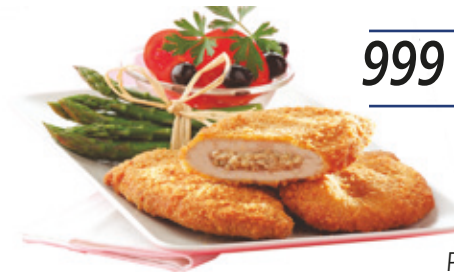
Pan. Velővel tölt. sertéskaraj 12x750 g