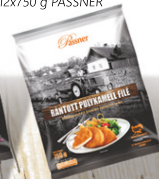
Pan. pác. Pulykamellfilé 12x750 g PASSNER