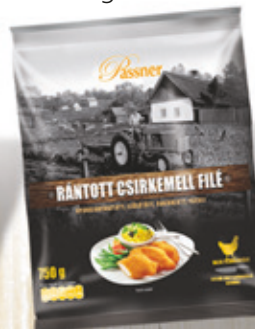
Pan. pác Csirkemellfilé 12x750 g PASSNER