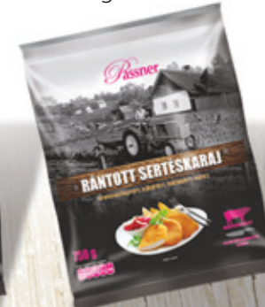
Pan. Sertés karajfilé 12x750 g PASSNER