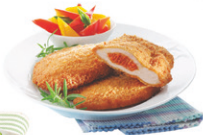
Pan. Kolbásszal tölt. sertéskaraj 12x750 g