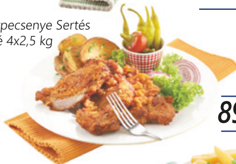
Cigánypecsenye Sertés tarjafilé 4x2,5 kg