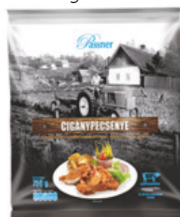
Cigánypecsenye sertés tarjafilé 12x750 g PASSNER