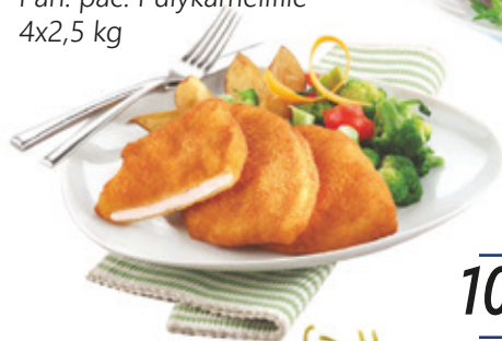
Pan. pác. Pulykamellfilé 4x2,5 kg