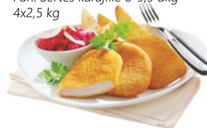
Pan. Sertés karajfilé 8-9,5 dkg 4x2,5 kg