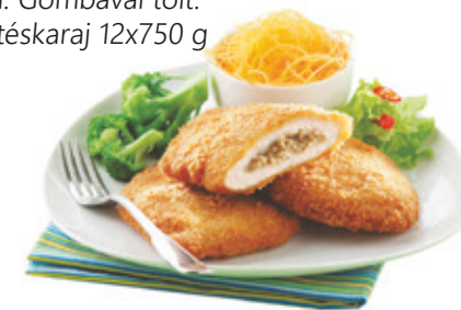
Pan. Gombával tölt. sertéskaraj 12x750 g