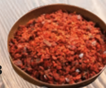
Magyaros fűszerkeverék 250 g

250 g/cs 449,- Ft/cs + áfa Bruttó ár: 570,23