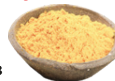
Gyömbér őrölt, 250 g

250 g/cs 499,- Ft/cs + áfa Bruttó ár: 633,73