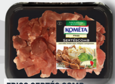
FRISS SERTÉS COMB kock eg 500 g vg