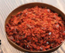
Magyaros fűszerkeverék 250 g

250 g/cs 449,- Ft/cs + áfa Bruttó ár: 570,23