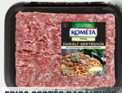
FRISS SERTÉS DARÁLT HÚS 70% vg. e. 1 kg