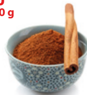
Fahéj őrölt, 250 g

250 g/cs 299,- Ft/cs + áfa Bruttó ár: 379,73