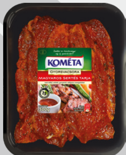
MAGYAROS PÁCOLT S. TARJA csn. 500 g