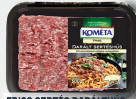
FRISS SERTÉS DARÁLT HÚS 70% vg. e. 500 g