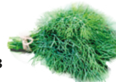
Kaporlevél 250 g

250 g/cs 499,- Ft/cs + áfa Bruttó ár: 633,73