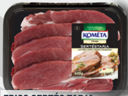
FRISS SERTÉS TARJA csn.szel. vg. 600 g eg.