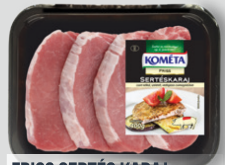
FRISS SERTÉS KARAJ csn. szel. vg. 400 g eg.

TOVÁBBI INFORMÁCIÓKÉRT ÉS AJÁNLATOKÉRT ÉRDEKLŐDJÖN ÉRTÉKESÍTŐINKNÉL: ☎ 80/201-101