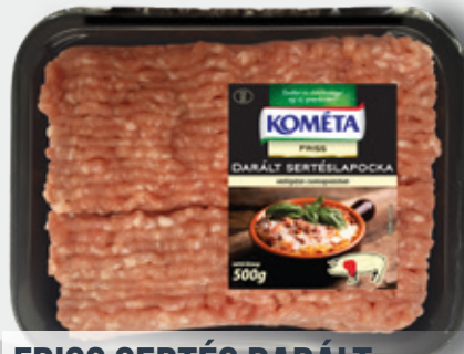
FRISS SERTÉS DARÁLT LAPOCKAHÚS vg. 500 g