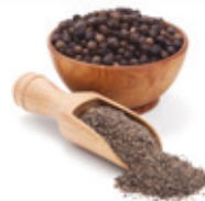
Fekete bors őrölt, 250 g

250 g/cs 849,- Ft/cs + áfa Bruttó ár: 1078,23