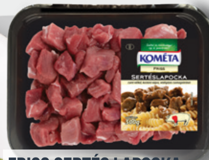
FRISS SERTÉS LAPOCKA csn. kock. vg. 500 g eg