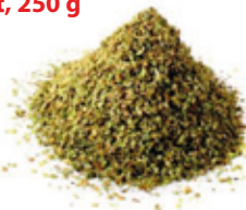
Majoranna morzsolt, 250 g

250 g/cs 439,- Ft/cs + áfa Bruttó ár: 557,23