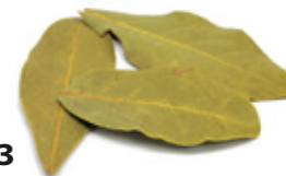
Babérlevél egész 250 g

250 g/cs 549,- Ft/cs + áfa Bruttó ár: 697,23