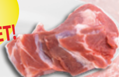
FRISS marhalábszár csont nélkül