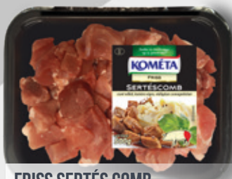
FRISS SERTÉS COMB