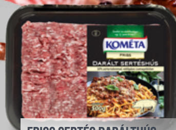
FRISS SERTÉS DARÁLT HÚS