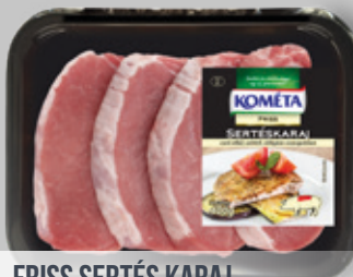
FRISS SERTÉS KARAJ