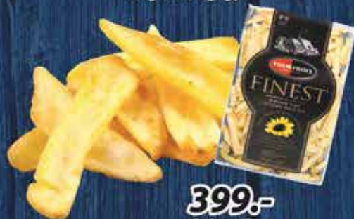
Farm U-alakú hasáburgonya 2 kg, 6x2 kg/gy

Próbálja ki őket minél előbb! Vásároljon egyidejűleg legalább 4 kartonnal a Húsháznál kapható új Farm burgonyák közül és cserébe megajándékozunk egy galléros, himzett Farm pólóval!