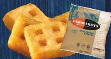
Farm mini rácsos burgonya 1 kg, 10x1 kg/gy