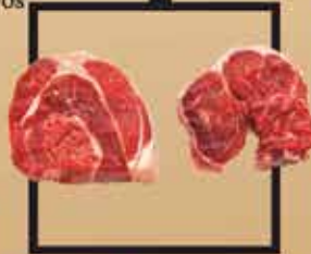
Blonde d'Aquitaine marha lábszár