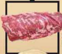
Blonde d'Aquitaine marha lapocka