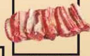
Blonde d'Aquitaine marha oldalas