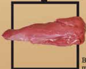
Blonde d'Aquitaine marha bélszín