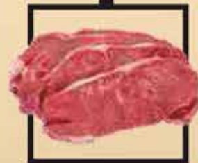
Blonde d'Aquitaine marha hátszín