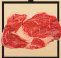
Blonde d'Aquitaine marha rostélyos