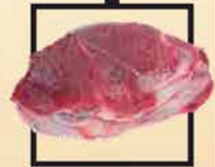
Blonde d'Aquitaine marha nyak