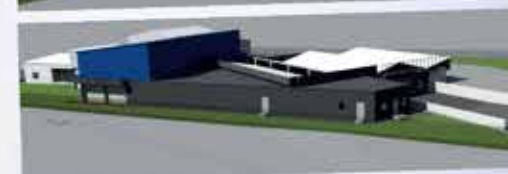
Terveink 2018 tavaszára

Mellékesen még egy példa arra, hogy mennyire összefonódik a Húsház létrejötte az életemmel: - Amikor 1997 tavaszán megálmodtuk a telephelyet, betértem egy a lakhelyemhez közeli nyomtatvány boltba Zuglóban, hogy elkészítessem a szükséges bélyegzőt, és névjegykártyákat. A rendelésemet egy gyönyörű leányzó vette fel, aki azonnal elvarázsolt. Úgy alakult, hogy többször vissza kellett térnem az üzletbe. Bár még sokat kellett udvarolnom, végül feleségül vettem. A házasságból három gyönyörű gyermek született, és minden nehézség ellenére, ma is igazán boldogok vagyunk együtt.