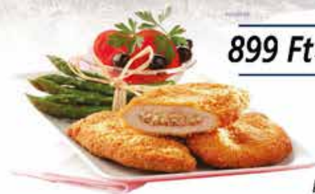
Pan. Velővel tölt. sertéskaraj 12x750g