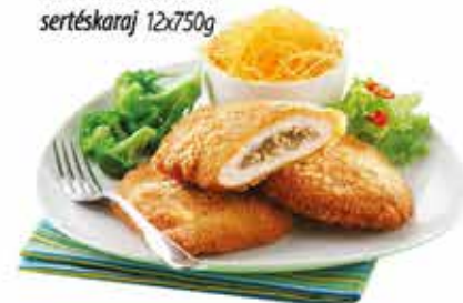
Pan. Gombával tölt. sertéskaraj 12x750g