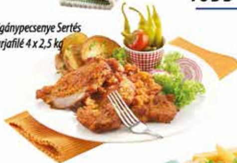
Cigánypecsenye Sertés tarjafile 4 x 2,5 kg