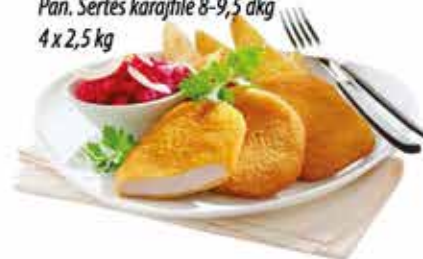
Pan. Sertés karajfile 8-9,5 dkg 4 x 2,5 kg