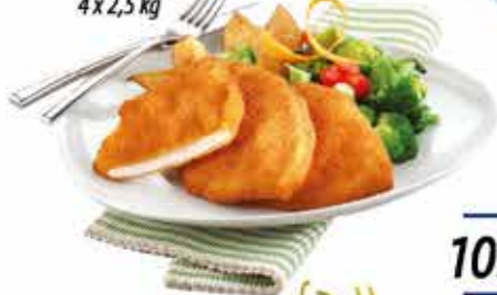
Pan. pác. Pulykamellfilé 4 x 2,5 kg