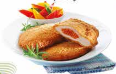
Pan. Kolbással tölt. sertéskaraj 12x750g