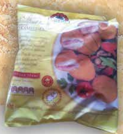
gallicoop sajtos-sonkás érme

12x500 g/gy, 319,- Ft/cs+Áfa Bruttó ár: 405,13