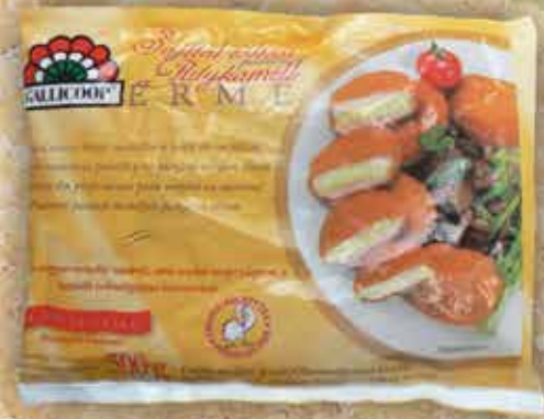
gallicoop sajtos érme

12x500 g/gy, 349,- Ft/cs+Áfa Bruttó ár: 443,23