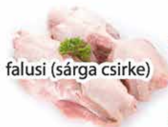
falusi (sárga csirke)