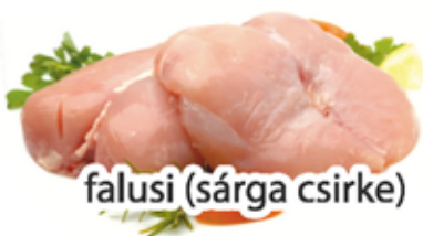
falusi (sárga csirke)