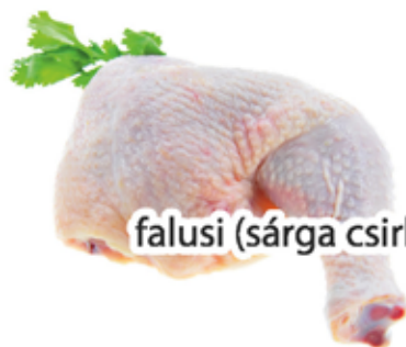
falusi (sárga csirke)