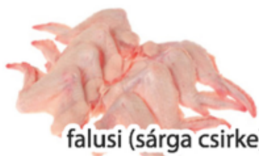
falusi (sárga csirke)