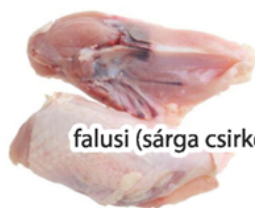
falusi (sárga csirke)