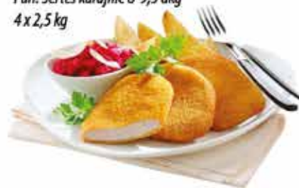
Pan. Sertés karajfilé 8-9,5 dkg 4 x 2,5 kg