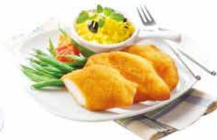
Pan. pác. Csirkemellfilé 4 x 2,5 kg