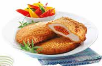
Pan. Kolbásszal tölt. sertéskaraj 12x750g