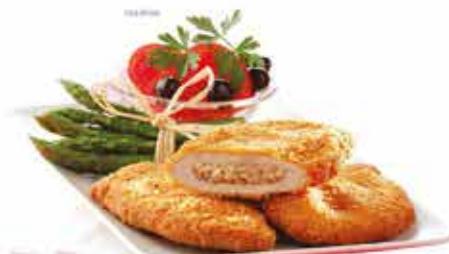
Pan. Velővel tölt. sertéskaraj 12x750g