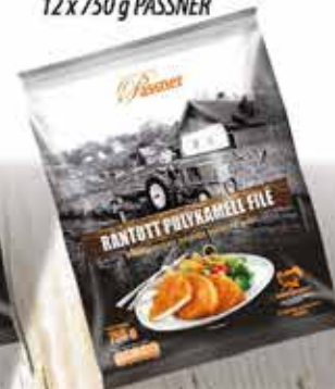
Pan. pác. Pulykamellfilé 12 x 750 g PASSNER