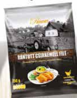
Pan. pác. Csirkemellfilé 12 x 750 g PASSNER