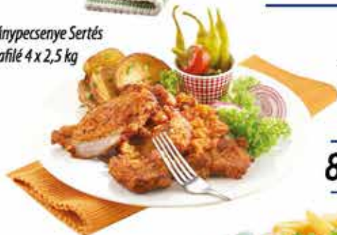
Cigánypecsénye Sertés tarjafilé 4 x 2,5 kg