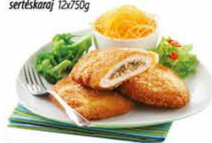
Pan. Gombóval tölt. sertéskaraj 12x750g