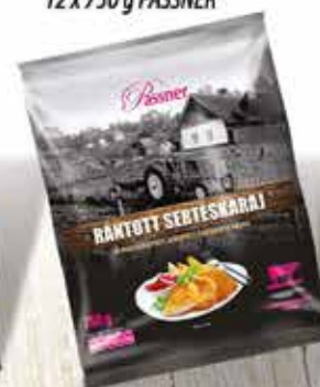
Pan. Sertés karajfilé 12 x 750 g PASSNER