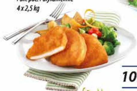
Pan. pác. Pulykamellfilé 4 x 2,5 kg