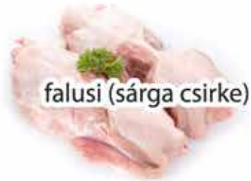
falusi (sárga csirke)