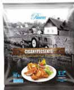
Cigánypecsénye sertés tarjafilé 12 x 750 g PASSNER