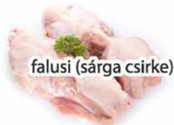
falusi (sárga csirke)