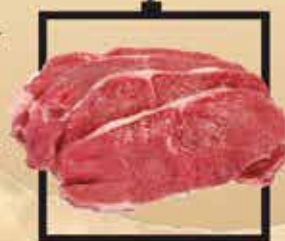
Blonde d'Aquitaine marha hátszín