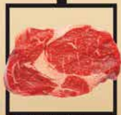
Blonde d'Aquitaine marha rostélyos