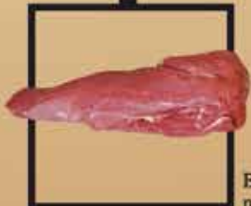
Blonde d'Aquitaine marha bélszín