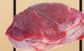
Blonde d'Aquitaine marha nyak