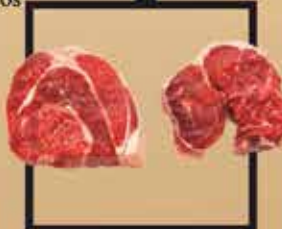
Blonde d'Aquitaine marha lábszár