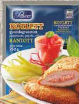
Pan. Sonkakrémmel tölt. sertéskaraj 12 x 750 g