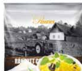
Pan. pác. Csirkemellfile 12 x 750 g