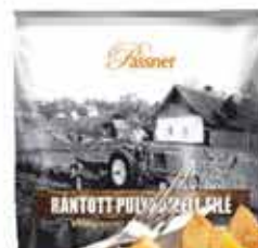
Pan. pác. Pulykamellfile 12 x 750 g