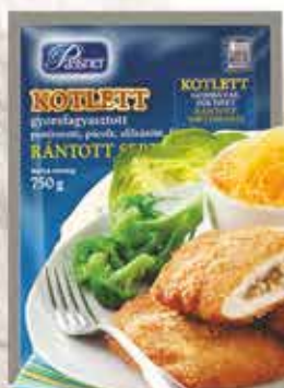
Pan. Gombával tölt. sertéskaraj 12 x 750 g