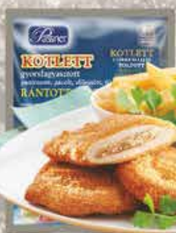
Pan. Csirkemájjal tölt. karaj 12 x 750 g