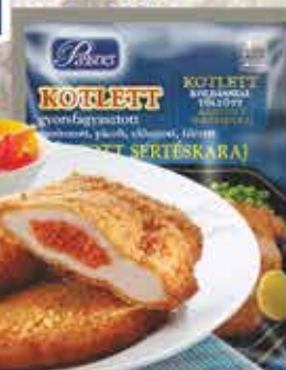
Pan. Kolbással tölt. sertéskaraj 12 x 750 g