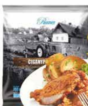
Pan. Cigánypecsenye sertés tarjafile 12 x 750 g