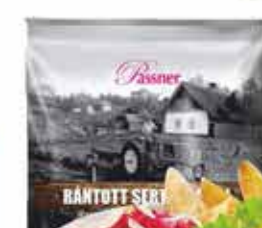
Pan. Sertés karajfile 12 x 750 g