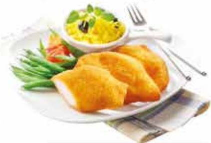
Pan. pác. Csirkemellfilé 4 x 2,5 kg