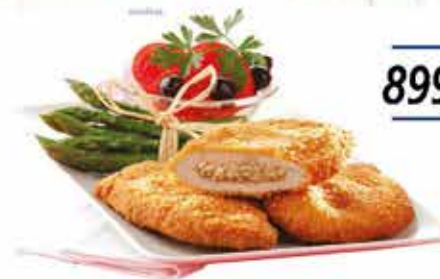
Pan. Velővel tölt. sertéskaraj 12x750g