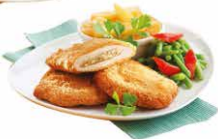
Pan. Sajittal tölt. sertéskaraj 12x750g