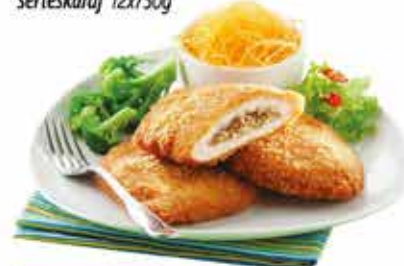
Pan. Gombával tölt. sertéskaraj 12x750g