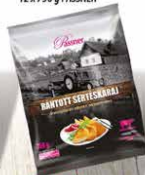
Pan. Sertés karajfilé 12 x 750 g PASSNER