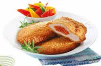
Pan. Kolbással tölt. sertéskaraj 12x750g