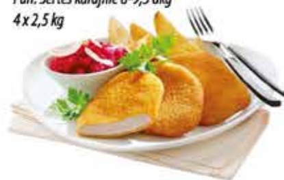
Pan. Sertés karajfilé 8-9,5 dkg 4 x 2,5 kg