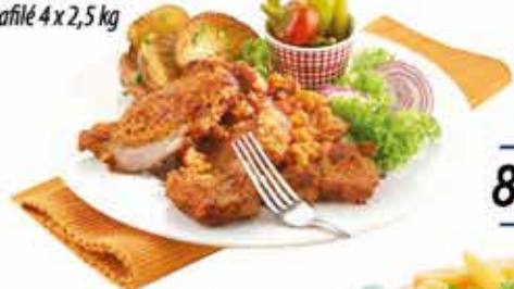
Cigánypecsenye Sertés tarjafilé 4 x 2,5 kg