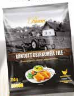
Pan. pác. Csirkemellfilé 12 x 750 g PASSNER