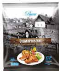
Cigánypecsenye sertés tarjafilé 12 x 750 g PASSNER