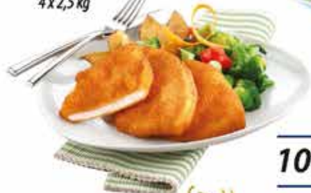
Pan. pác. Pulykamellfilé 4 x 2,5 kg