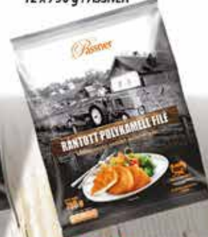
Pan. pác. Pulykamellfilé 12 x 750 g PASSNER