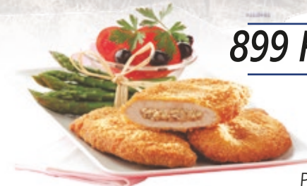
Pan. Velővel tölt. sertéskaraj 12x750 g