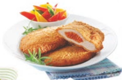
Pan. Kolbással tölt. sertéskaraj 12x750 g