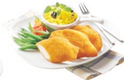
Pan. pác. Csirkemellfilé 4x2,5 kg