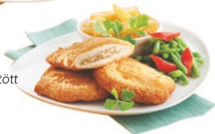
Pan. Csirkemájjal töltött sertéskaraj 12x750 g