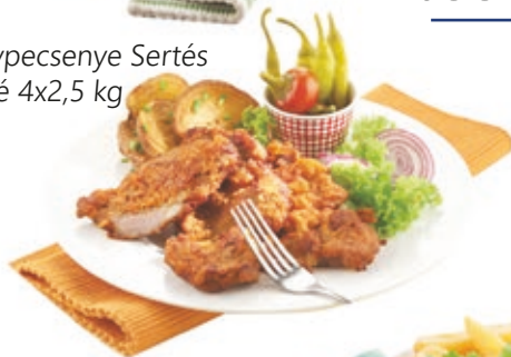
Cigánypecsenye Sertés tarjafilé 4x2,5 kg