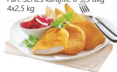
Pan. Sertés karajfilé 8-9,5 dkg 4x2,5 kg