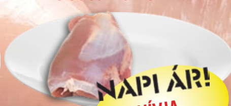
FRISS pulyka felsőcombfilé