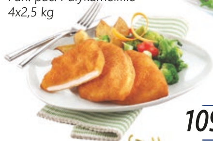
Pan. pác. Pulykamellfilé 4x2,5 kg