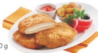
Pan. Sajttal tölt. sertéskaraj 12x750 g