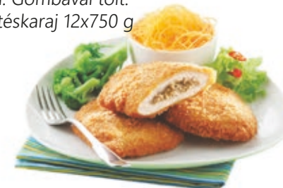
Pan. Gombával tölt. sertéskaraj 12x750 g