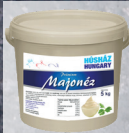
Húsház Prémium Majonéz 50%-os 5kg